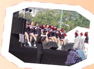
充実したステージイベント♪

大倉山キャンパス(楠キャンパス)近くにある噴水広場で行われる医学部医学科の学祭です。卒業生や一般の方々まで多くの方が来場して賑わいます。近年はコロナ禍の影響で開催ができていませんでしたが、2023年度はステージイベントのみ復活しました!