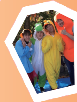
着ぐるみを着ている人も!

2日間にわたって行われる、神戸大学最大の学園祭です。有名人による講演会や、プロアーティストのコンサートが行われることもありますよ! 様々なサークルが工夫を凝らした出店では美味しそうなものばかり売られていて、どれを買おうか迷ってしまいます。