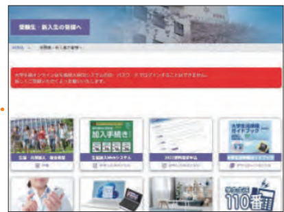
※写真は昨年度版です